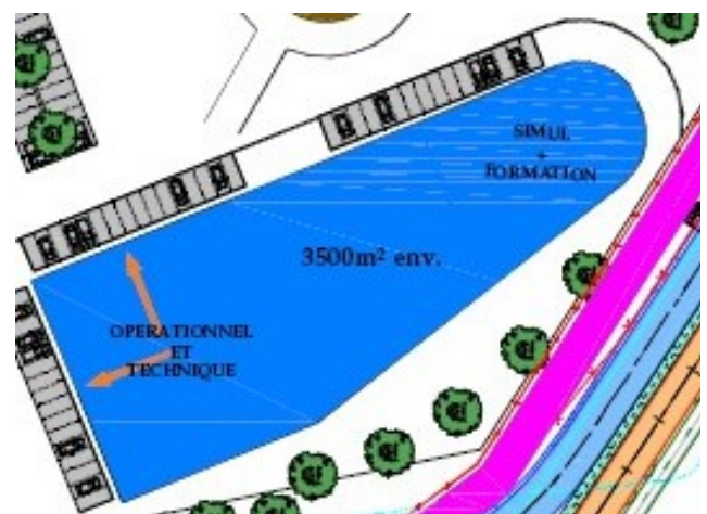
1500m 2 pour la salle de contrôle OPERA qui accueillera quelques 400 contrôleurs et près de 60 positions de contrôle

5,2 hectares, 7.000 m 2 de bâtiment OPERA (3.500 m 2 par étage), 2.000 m 2 pour l'espace vie (restauration et associations), 10.000 m 2 d'installation sportives... voici les premiers éléments retenus pour la construction du nouveau centre. Les personnels au cœur d'OPERA devraient ainsi trouver en environnement professionnel inégalé à ce jour en Europe.