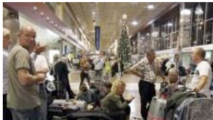
Des voyageurs bloqués en raison de la grève des contrôleurs aériens.

Les deux tiers d'entre eux ont regagné leurs postes. L'espace aérien est "totalement ouvert", a annoncé le ministre des Transports, qui estime qu'il faudra "24 à 48 heures" pour revenir à la normale.